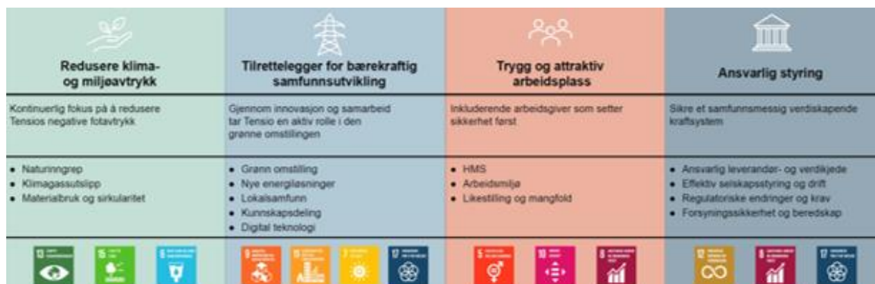
Figur 2: Fokusområder og vesentlige temaer i Tensios bærekraftstrategi

Tensio har definert fire fokusområder som danner grunnlaget for konsernets bærekraftarbeid. Disse omfatter klima og miljø, sosiale forhold og ansvarlig forretningsstyring.