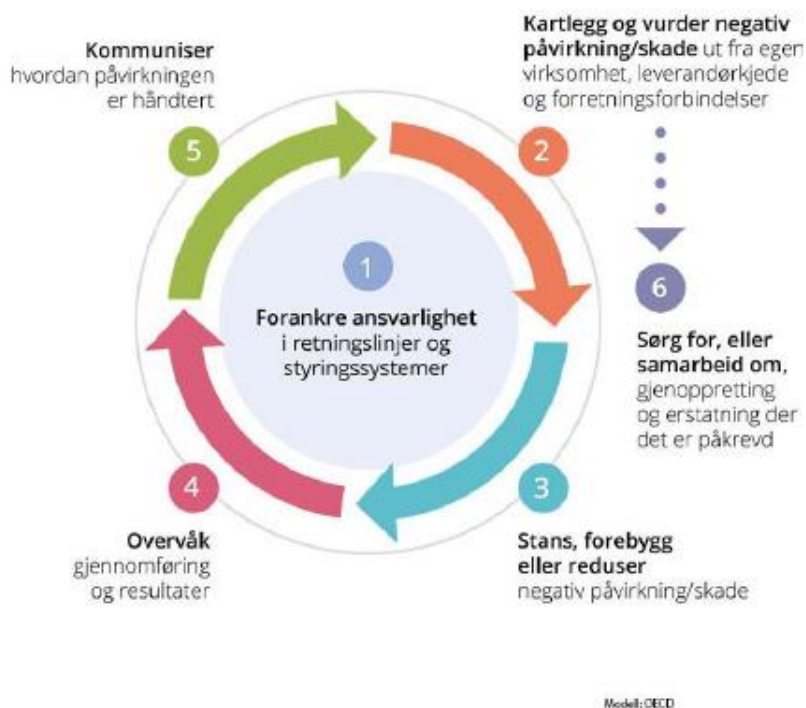
Figur 3: OECDs modell for aktsomhetsvurderinger

Tensio har etablerte rutiner for å følge med på og hensynta påvirkningen Tensio har på mennesker og samfunn som følge av vår virksomhet.